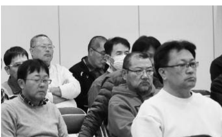
講演を聞く参加者

学校は順次再開されてきたが、子供たちの心のケアや深刻な教員不足など課題は山積している。安倍政権は、国土強靱化計画、オリンピック誘致など、復興の妨げになるような政策ばかりを打ち出してきた。現に、資材不足や材料費・人件費の高騰に拍車がかかり、復興関連の公共事業の妨げになっている。また、人間には制御できないのが「原子力」だが、原発再稼働の動きは加速し、運転延長も、原発事故の恐ろしさ