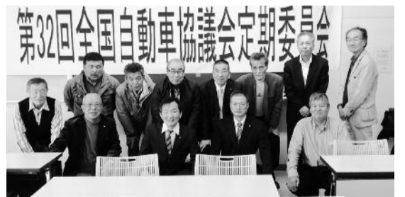
第32回自動車協議会定期委員会