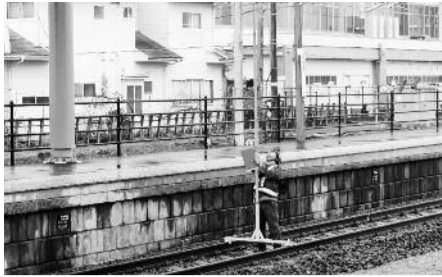
浪江駅で検測する作業員