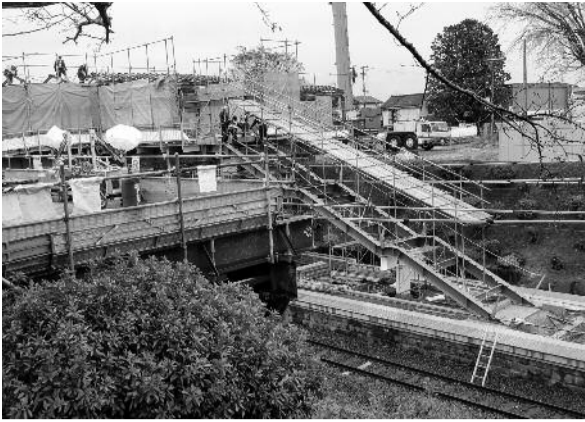
工事中の夜ノ森駅