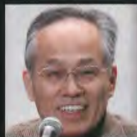
評論家 佐高 信