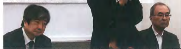
「支援する会」が院内集会(10月10日)