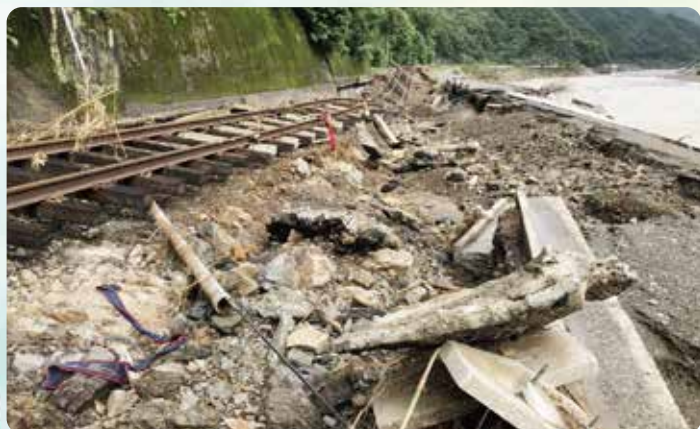
被災したJR肥薩線（葉木～鎌瀬間）

毎 年のように発生する記録的な河川の氾濫や土砂災害により、橋梁や線路が流失・崩壊するなど多くの鉄道施設にも甚大な被害が出ています。今まさに新たな法整備や助成金・交付金の拡充など国としての対応強化や仕組みづくりが早急に求められています。また、防災・減災対策とともに経年劣化によるトンネル・橋梁など鉄道施設の老朽化対策も深刻となっており、国や自治体が一体となって社会的インフラ基盤の整備を推し進めていくことが喫緊の課題です。